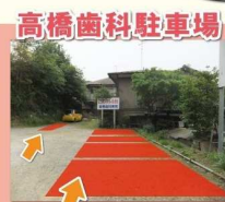
この列に4台止められます