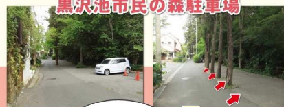
黒沢池市民の森駐車場